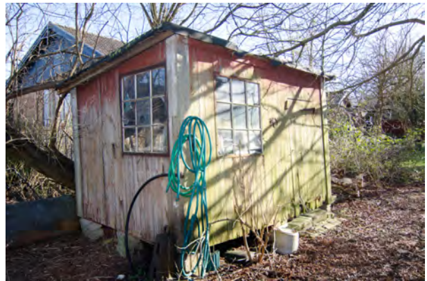
Förråd i trä