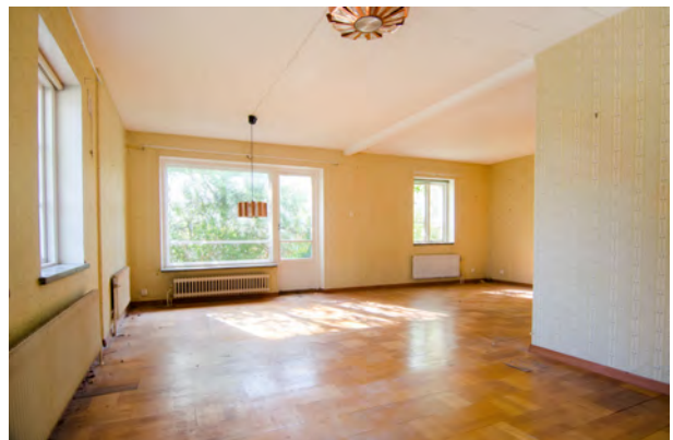
Vardags- och matrum